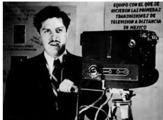
Guillermo Gonzalez Camarena Color TV