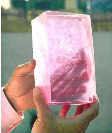
transparent concrete 2008